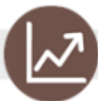
DIAGRAMA DE CONTROLE

Como não há pelo menos 7 anos de dados históricos disponíveis ou pelo menos uma média de ocorrências suficiente para construir o diagrama de controle (dependendo da população do local ou região em análise), analisa-se a distribuição dos casos nos últimos dois anos epidemiológicos.